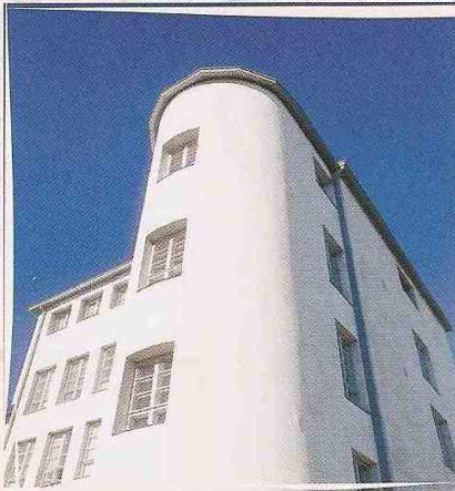
Marttiini's Old Factory